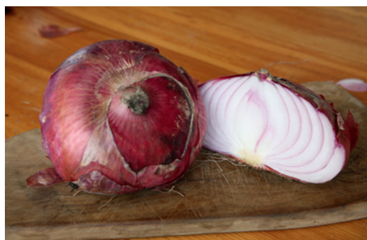
Cipolla Rossa di Breme