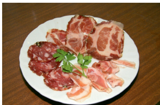
Salumi vari dell'Oltrepò

Raccolta diretta in azienda (pick up your own): la voglia e il bisogno di tornare alla terra ha generato questa particolare forma di vendita dove il consumatore acquista prodotti da lui stesso direttamente raccolti. Il modello prevede che i consumatori entrino in azienda e raccolgano loro stessi i prodotti coltivati in azienda. Questo approccio è prevalentemente diffuso nei prodotti ortofrutticoli caratterizzati dalla semplicità della fase di raccolta e da elevati fabbisogni di lavoro in questa fase. Poiché le aziende di questo tipo invitano i clienti al loro interno, è necessario assicurare condizioni ambientali sicure ed evitare ogni causa di incidente, nonché possedere una copertura assicurativa adeguata al tipo di attività.