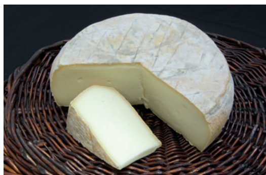
Formaggella di Menconico

hanno iniziato a sostenere nuove forme di commercio dei loro prodotti. Nascono in quest'ottica i farmers' market, i punti vendita aziendali ed i gruppi d'acquisto che permettono al consumatore di entrare nei processi produttivi, di conoscere cosa si acquista e chi con il suo lavoro sostiene la nostra alimentazione.