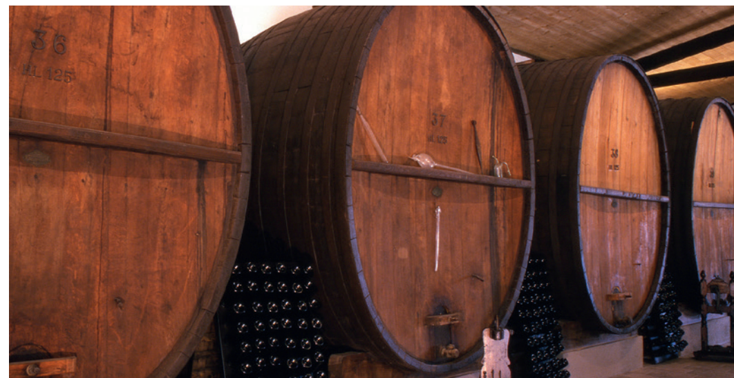
Le cantine dell'Oltrepò pavese

Le aziende certificate devono documentare ogni passaggio su appositi registri predisposti dal Ministero per assicurare la totale tracciabilità.