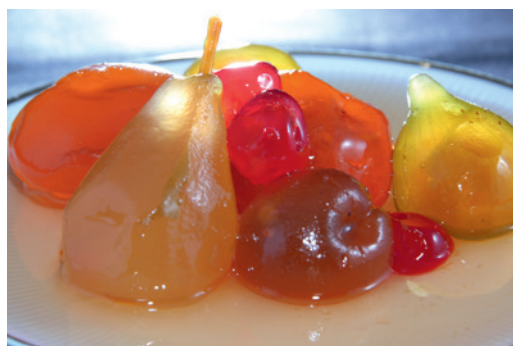
Mostarda di Voghera

La risposta a questa necessità di trasparenza di una larga fascia della popolazione è da ritrovare nell'impegno di molti imprenditori agricoli che