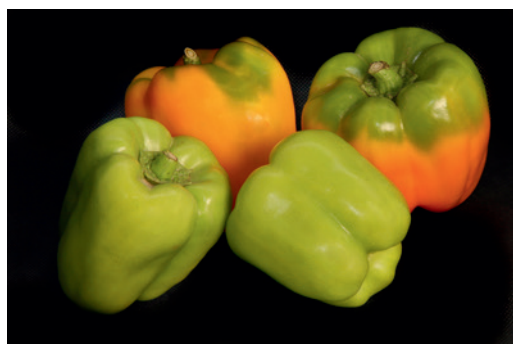
Peperoni di Voghera